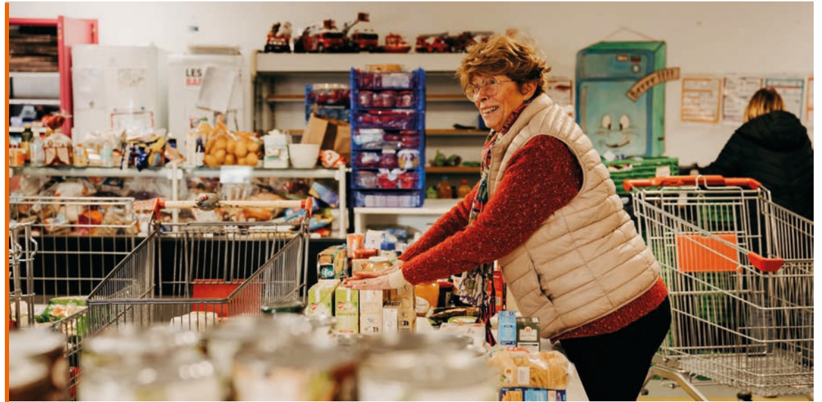
Au total, le soutien de l'État pour l'aide alimentaire s'élève à 156 M€ en 2023.

Après l'intervention télévisée du président des Restos du cœur, le gouvernement accélère le déploiement des fonds promis dans le cadre du programme « Mieux manger pour tous » pour venir en aide aux associations caritatives en difficulté. De leur côté, les entreprises multiplient les promesses de dons.