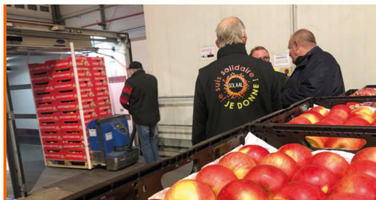
Certaines entreprises agroalimentaires ont opté pour le don en nature, comme les agriculteurs avec Solaal.

Pendant que le ministère des Solidarités gère l'urgence, celui de l'Agriculture se penche sur les besoins « à moyen et long terme », déclare Marc Fesneau. Les sujets de la simplification des procédures de dons et de marchés publics, ainsi que la logistique ont été évoqués à l'occasion d'une réunion avec les acteurs impliqués dans l'aide alimentaire (associations caritatives, représentants des filières agricoles, industriels, distributeurs), le 6 septembre. Dans l'immédiat, les besoins se situent principalement sur l'approvisionnement en produits frais (fruits et légumes, lait et viande). Les Banques alimentaires sont par exemple, « en rupture » sur le lait et ont besoin de l'équivalent de 3 M€ de lait d'ici juin 2024.